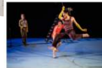
Vier de seizoenen bij VIER

Vrolijke familievoorstelling VIER van Utrechts dansgezelschap De Dansers op zondag 17 april. VIER is een speelse mix van energieke, acrobatische dans en live muziek! Met na afloop een VIER seizoenen spel en een dansworkshop! 4+