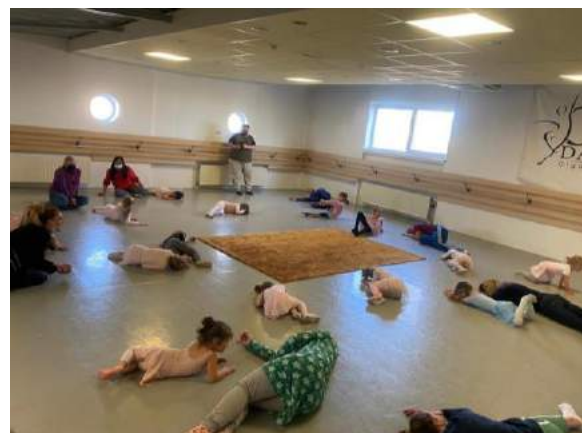
Smaakmakers workshop, dansschool Houten