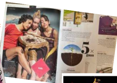
- Mens en Wijk januari 2022 #36