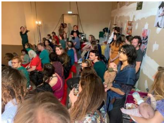
Havenloods Cultuurfestival, studio De Oester