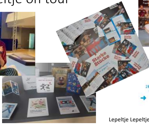
Côte Cour Festival Lesbrief Lepeltje Lepeltje in het Frans