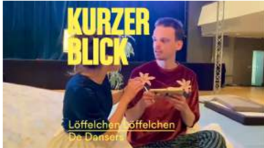
KunstFestSpiele HerrenHausen Teaser video Instagram