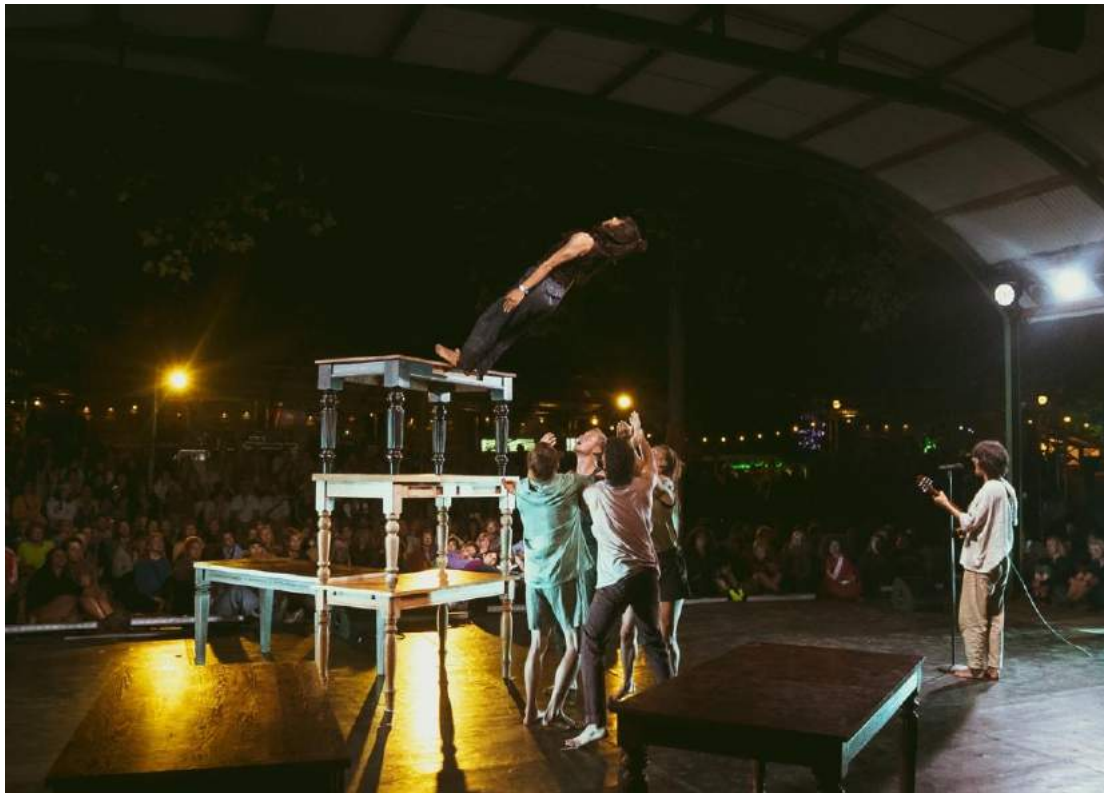
Hold Your Horses op Down The Rabbit Hole

Als klap op de vuurpijl sleepte De Dansers aan het einde van de zomer verschillende prijzen en nominaties in de wacht: een VSCD Zilveren Krekel en Keuze van de Wijkjury Utrecht voor Hold Your Horses en twee nominaties voor de VSCD Jonge Zwaan voor VIER . De groei van naamsbekendheid en publieksbinding worden gereflecteerd in toename van het bereik op social media: op Instagram steeg het aantal volgers van 2.432 naar 3.200. Het aantal Facebook volgers steeg van 2578 naar 3008.